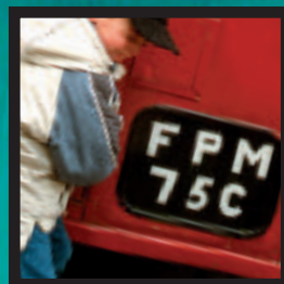
BELLE PEREZ OP SCHOOL p. 2

Maar eigenlijk zijn ze vroeger op vakantie vertrokken of op verlengd weekend (luxeverzuim). In andere gevallen zijn de onwettige afwezigheden een signaal van grote problemen : de ouders kunnen geen dokter betalen, kinderen moeten in het huishouden helpen of worden verwaarloosd... Elk kind heeft recht op onderwijs. Waarom is uw kind (soms) 'ziek'? En wanneer begint de krokusvakantie?