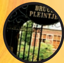
GRATIS SPEURNEUZEN IN MECHELEN