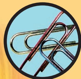
HOE LEER IK MIJN KIND LEREN?