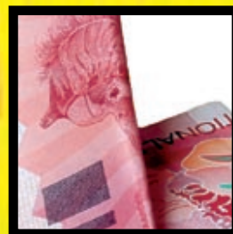
«GEEN ENKELE STRAF HELPT» p. 4