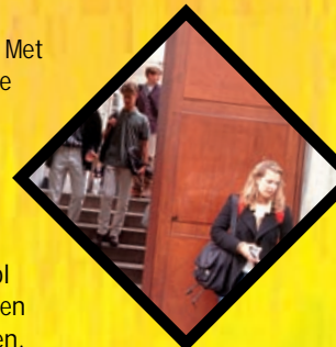
HOE ANDERS IS ONZE SCHOOL? p. 2

Ouders willen het beste voor hun kinderen. Met vallen en opstaan zoeken ze hun weg. Ze lopen met hun kop tegen de muur of beleven hemelse momenten. Maar ze geven niet op. Tussen zulke ouders voelt Klasse voor Ouders zich thuis. Niet als een kant-en-klaar recept, maar als een tafel vol ingrediënten. Iedereen kan er zijn eigen menu mee samenstellen. Bedankt voor zoveel vertrouwen. Daarom bouwen we samen een feestje. Omdat verjaren leuker is met velen. U bent persoonlijk uitgenodigd en krijgt een VIP-ontvangst met het hele gezin. Kijk snel op pagina 8.