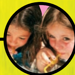
VERJAARDAGSFEST MET KLASSE p. 8

Gratis met het gezin naar Disneyland (p. 8)