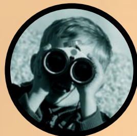
GRATIS FEEST IN HET PARK p. 8

Tien jaar geleden vond één vader op drie in Vlaanderen het vanzelfsprekend dat de opvoeding van de kinderen voor hun vrouw was. Bijna de helft van de vaders tussen 36 en 40 jaar was daarvan overtuigd. Bij jongere vaders, tussen 25 en 30 jaar, dacht slechts één op vijf zo. 42 % van de vaders hield zich niet met de kinderen bezig. 58 % gemiddeld één uur per weekdag. Recente cijfers zijn er niet. De 'nieuwe' vaders intussen wel.