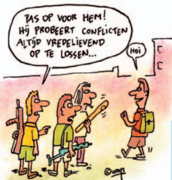
Kinderen doen niet wat je zegt, maar wat je doet.

Elke week zet Klasse een leerkracht in de bloemen. Vertel ons waarom de leerkracht van uw kind het verschil maakt. Stuur uw brief naar Klasse voor Ouders (BLOEMEN VOOR) – Koning Albert II-laan 15 – 1210 Brussel – tel 02-553 96 90 – fax 02-553 96 85 – e-mail info@klasse.be. Er zijn héél veel aanvragen maar misschien verrassen we de leerkracht van uw kind wel in de klas.