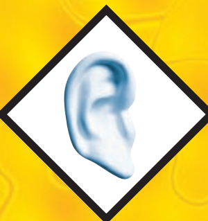
«IK KIJK MET ANDERE OGEN NAAR LEERLINGEN» p. 2-3