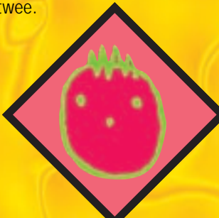
KINDEREN GRATIS NAAR ANTWERPEN p. 8