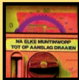
OVERLEGT U MET UW KIND? p. 4-5

Krijgen ze evenveel kansen? Of blijft u hangen bij de verschillen die u ziet? Op pagina twee vindt u misschien de gelijkenissen die u nooit zag.