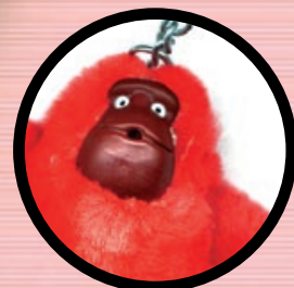
NAAR SCHOOL VOOR DE VRIENDEN p. 2-3

Klasse voor Ouders is een initiatief van het departement Onderwijs van het ministerie van de Vlaamse Gemeenschap. Dit blad is er elke maand (zo rond de vijftiende), gratis voor alle ouders van kinderen in de kleuterschool tot en met de eerste graad secundair onderwijs. Het blad wil ouders en school een stap dicht er bij elkaar brengen. Zo kan er vertrouwen groeien en wederzijds respect. En dat maakt het een stuk makkelijker: thuis en op school. Wie het schoentje past, trekke het aan. Veel plezier.