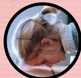
GRATIS ONTDEKKINGSTOCHT MET KLASSE p. 8