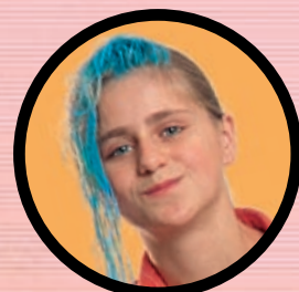
«TIEN KEER OVERSCHRIJVEN» p. 4-5