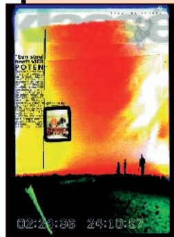
Klasse voor Jongeren 9 al gezien?

Van bij het begin heeft Klasse grote aandacht besteed aan de vormgeving van de verschillende bladen. Hoe communiceer je met leerkrachten, met ouders, met jongeren...? Vorm, inhoud en visie moeten