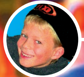
ANDY KRIJGT GEEN KANS p. 4-5