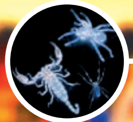
SPINNEN OP SCHOOL p. 2-3