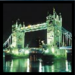
GRATIS NAAR LONDEN: UW KANS OP P. 8