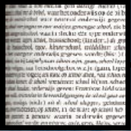
«WAT LEREN ZE OP SCHOOL?» P. 4