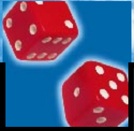
HOE KATRIEN HAAR KEUZE MAAKT P. 2

Ouders en leerkrachten kiezen nog vaak in de plaats van kinderen. Zij bepalen wat kinderen die dag aantrekken, wat ze die dag doen, hoe ze een vraagstuk oplossen, wanneer ze beginnen studeren... Ze leiden kinderen alsof ze blind zijn. Kinderen moeten dan nooit kiezen. Ze kunnen niet kiezen. Ook niet als ze een belangrijke keuze moeten maken. Welke studierichting ga ik volgen? Wat wil ik later worden? «Vroeger was het gemakkelijker», zeggen ouders dan. «Nu weten we niet meer wat te kiezen». Het gevaar is groot dat het de verkeerde keuze wordt.