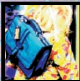
JONGE RUGGEN DANKEN U p. 8