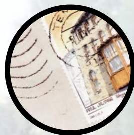
EEN SCHOOL VOOR OUDERS p. 2-3

Uw kind moet toch ook elke dag de straat op.