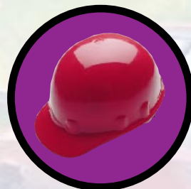
«IK ZOU GEEN LERAAR WILLEN ZIJN» p. 4-5