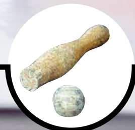
KIND IN HET KEGELSPEL p. 6-7