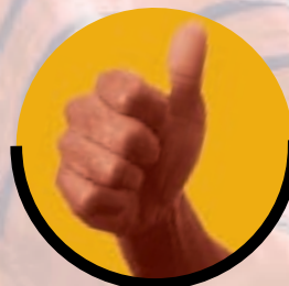
TOM EN HET GEHEIM VAN ZIJN SUCCES p.4-5