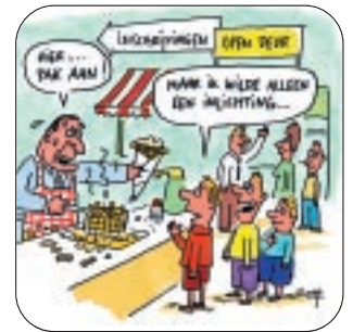
Opendeurdag: verhip, is dat onze school? p. 30-31

Op de opendeurdag kan plots alles. Zo mochten de leerlingen in een kermisattractie eieren gooien naar het hoofd van de leraars. Elders krijgen leerkrachten nauwelijks de kans om met de ouders te praten: de afwas gaat voor. Vol goede bedoelingen is de opendeurdag blijkbaar vaak ook de dag van de gemiste kansen.