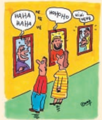
Klasse komt naar uw school.