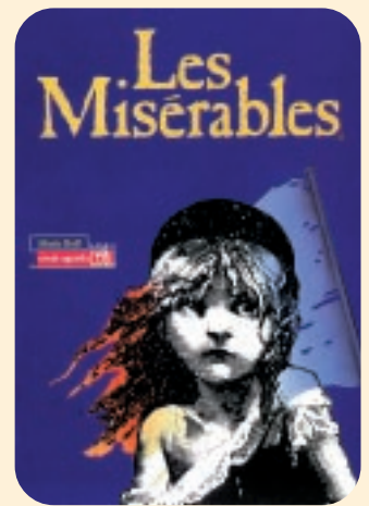
Met uw klas mee op de barricades