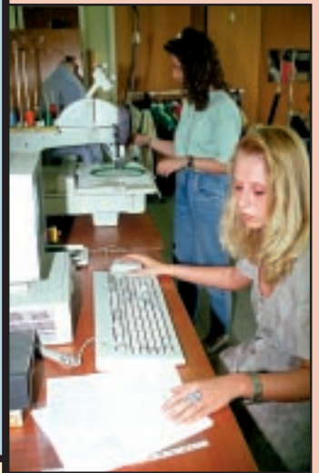
De kledingsector heeft geen laaggeschoolden nodig.