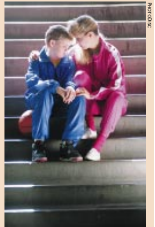
Kinderen kunnen hun rechten doen respecteren

De nare gebeurtenissen met de verdwenen en vermoorde kinderen verhoogt de druk op de school. De gemeenschap verwacht dat het onderwijs gepaste maatregelen neemt en iets doet aan de sociale weerbaarheid van de kinderen. Voor de eindtermen sociale vaardigheden in het basisonderwijs had de Dienst voor Onderwijsontwikkeling (DVO) oorspronkelijk «de lichamelijke en seksuele relatie» en «de leerlingen weten zich te verdedigen tegen ongewenste lichamelijke nabijheid of intimiteit van leeftijdgenoten of anderen» opgenomen. Maar na het maatschappelijk debat en de inspraak van alle onderwijspartners , zoals de koepels, werden deze eindtermen uit de voorstellen geschrapt.