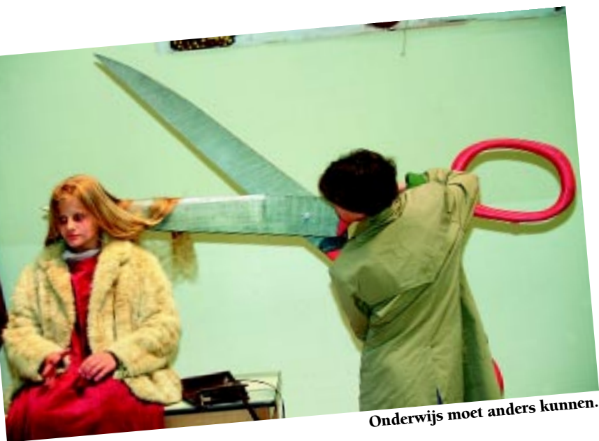
Onderwijs moet anders kunnen.

De Appeltuyn, een kleine Leuvense kleuter- en lagere school, bestaat 20 jaar.