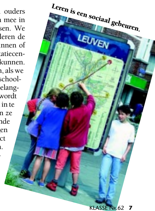
Leren is een sociaal gebeuren.