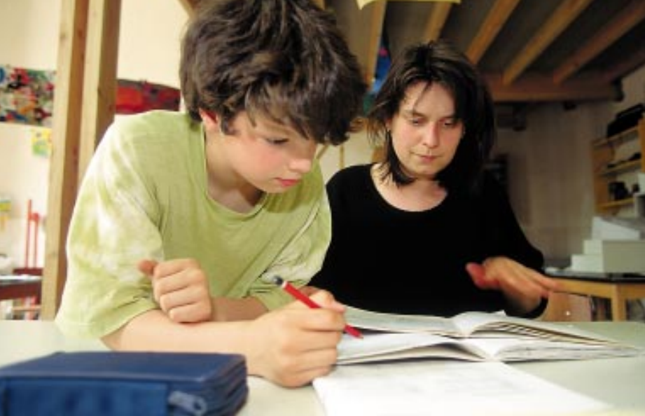
De leerkracht is verantwoordelijk voor elke leerling.

«Samen, gewoon... buitengewoon!»: op 27 april organiseert de Vlaamse Onderwijsraad voor de FORUM tweedekeer een Forum Basisonderwijs . Dat is een netoverstijgende studiedag voor alle onderwijsparticipanten in het gewoon en het buitengewoon onderwijs: leerkrachten, directies, inrichtende machten, ouders en het onderwijsbeleid. Zorgverbreding: onze zorg, was in 1994 het thema. Hierbij rees de vraag hoe scholen en leerkrachten het onderwijs kunnen organiseren zodat elk kind zoveel mogelijk kansen krijgt om zich optimaal te ontplooiën. Er lag toen een spanningsveld tussen het gewoon en het buitengewoon onderwijs. Komt er nu een betere samenwerking tussen beide onderwijsvormen, waardoor de school voor alle kinderen open staat?