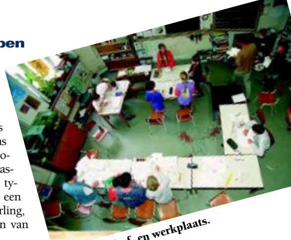
De klas als leef- en werkplaats.

Monica, een ouder, legt ons nog eens uit dat leerkrachten, kinderen én ouders samen de school besturen. «Wij draaien mee in het dagelijks functioneren van de klassen. We gaan mee naar toneel, mee zwemmen, leren de kinderen in ateliers wat ze zelf goed kunnen of graag doen, we houden het documentatiecentrum op peil... Onderwijs moet anders kunnen. Wij denken dat het enkel écht kan lukken, als we onze kinderen ernstig nemen en in de schoolpraktijk vertrekken vanuit hun eigen belangstellingsfeer. Dit betekent dat hen geleerd wordt met elkaar om te gaan, eigen standpunten in te nemen, eigen keuzes te maken. We leren ze ook, binnen het proces van voortdurende verandering en hernieuwing, in hun eigen leven en wereld in te grijpen. Zo'n project biedt geen harde garanties tot welslagen. Integendeel. Toch schept net deze breekbaarheid de voorwaarde om een onderwijsproces op gang te brengen dat écht kan lukken. En tenslotte, alles wat waardevol is, is kwetsbaar.» ■