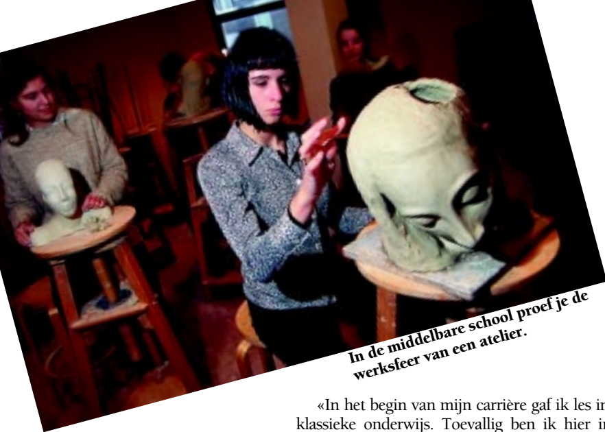
In de middelbare school proef je de werksfeer van een atelier.

Een Rudolf Steinerschool bezoeken verloopt in kleurfasen. Het zacht rozerood van de eerste klas omhult je in geborgenheid. Daarna verlopen de kleuren via oranje, geel, groen en blauwgroen naar een zelfstandig blauw in de negende klas. In de twaalfde klas is het blauw ten slotte opgelost in een verstild lila. Opvoeden onder de kleurensymboliek van de regenboog is beeldhouwersarbeid: het (vrij)maken van het beeld dat verborgen ligt in het materiaal. Een belangrijk accent in de Steinerpedagogie is namelijk belemmeringen wegnemen en mogelijkheden vrijmaken die in elk kind verborgen liggen. Elk kind kan een uniek, vrij en rijk ontwikkeld individu worden. Hoe word je wie je bent? Een verkenning van een Steinerschool, waar de jonge leerlingen zes jaar lang bij dezelfde leerkracht blijven.