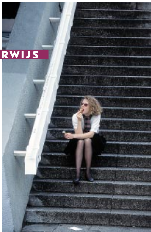
Het ASO bereidt veel leerlingen al lang niet meer voor op hoger onderwijs.

Wat loopt er zo fout in het secundair onderwijs, dat er blijkbaar zo'n grondige hervorming moet komen?